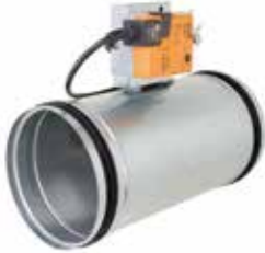
MR MAX motorisable

Le MR Max Motorisable est un régulateur de débit avec un débit stable et réglable à distance pour maîtriser QAI, confort et économie d'énergie.